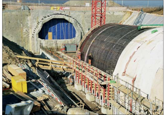
TC Moncalia (349 m): ferrailage étape de voûte, le 13 février 2008.