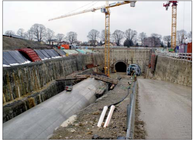
Longue de 465 m, la tranchée couverte des Granges s'abouche à une profondeur de 15 m environ au portail sud du tunnel sous la Trême.