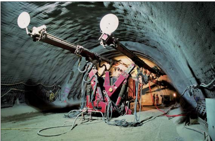
Tunnel sous la Trême: injection des colonnes Jetgrouting, 23 mai 2007.