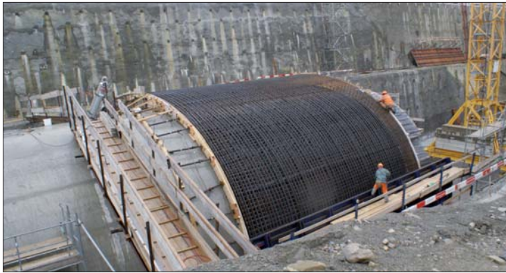
Élargissement de la TC des Granges: la création d'une place d'évitement et d'une galerie d'accès résulte du concept de sécurité.