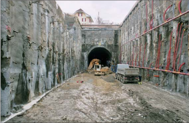
TC des Usisniers (265 m): enceinte de fouille et entrée nord du tunnel sous la Trême, le 2 avril 2008.