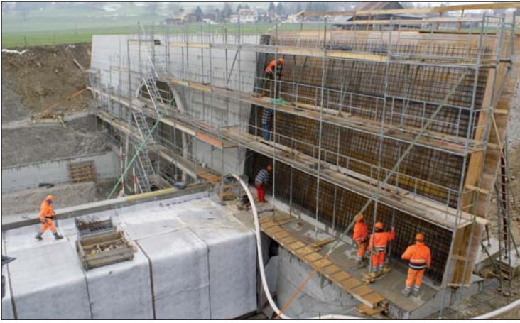
Les murs en pied de talus sont intégrés aux murs latéraux du portail des Granges. Du côté gauche de la route, le mur du portail fait office de mur de façade pour le local technique sud.