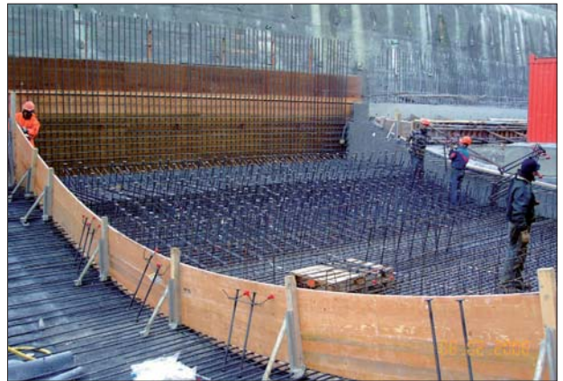
TC des Granges: armatures verticales de 90 cm de hauteur placées dans le radier de la tranchée couverte, dans les murs pieds droits puis dans les voûtes de façon à renforcer la résistance au cisaillement.