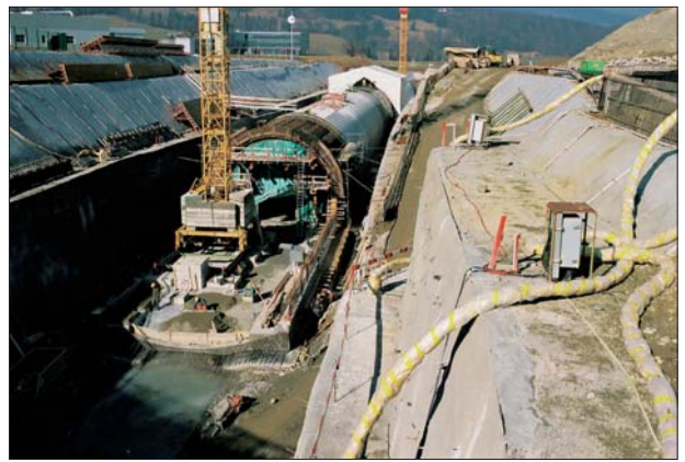
Vue d'ensemble travaux de la TC de Planchy (248 m), le 13 février 2008.

type d'armature est le gain de temps, qui est considérable pour l'entreprise, remarque Marc Barras, du bureau d'engineering Ancotech de Bulle. Nous avons livré sur le chantier environ 65'000 ancres verticales d'armature de cisaillement, ce qui représente quelque 80 tonnes d'acier. Un autre avantage - dans la mesure où on est en présence d'une galerie voûte avec un rayon relativement grand - est que les ingénieurs, l'entreprise et Ancotech ont pu opter pour des éléments qui épousent la forme arrondie de la tranchée avec des barres plates pourvues de trois têtes d'ancrage."