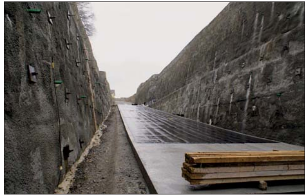
À la sortie du tunnel sous la Trême, dans la tranchée couverte des Granges et à la sortie du tunnel TPF à l'interface avec la tranchée couverte de Montcalia, une galerie d'accès part perpendiculairement à la route d'évitement pour aller rejoindre des routes communales toutes proches.

La structure de la chaussée est constituée d'un revêtement en trois couches et d'une couche de fondation de 80 cm d'épaisseur. Dans le secteur sud du tracé, depuis le portail des Granges à l'accrochage du Pré-du-Chêne, une étanchéité et un lestage sont mis en place en raison de la présence d'une nappe phréatique, dont le niveau est supérieur à celui de la route, ainsi que d'une portance réduite due à la présence d'alluvions post-glaciaires de faible qualité.