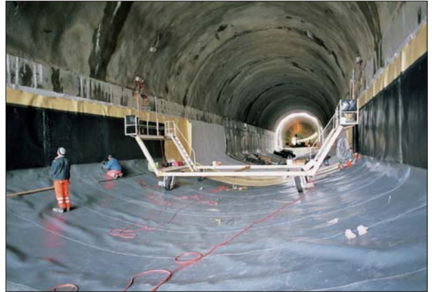
Tunnel sous voies TPF: travaux d'étanchéité, le 2 avril 2008.

Son rôle est de livrer le système spécial ancoPLUS, composé d'ancres de diamètre 10 à 30 mm. Celles-ci sont produites au moyen de barres d'armatures avec deux têtes d'ancrage forgées à 600°C. La hauteur des ancres s'adapte à l'épaisseur de la construction et elle n'est pas limitée. Une fois cette longueur définie, ces têtes d'ancrage sont soudées sur les barres de montage. Toutes ces armatures verticales - ici 90 cm de hauteur - sont placées dans le radier de la tranchée couverte, dans les murs pieds droits puis dans les voûtes de façon à renforcer la résistance au cisaillement. L'avantage de ce système est de permettre une réduction des épaisseurs de béton tout en augmentant la ductilité de l'ouvrage. "Un autre avantage de ce