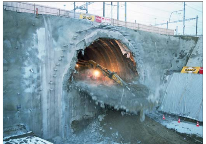
Percement du tunnel sous voies TPF, le 19 novembre 2007.

droit des ouvrages. Les profils types des tranchées couvertes sont les suivants: